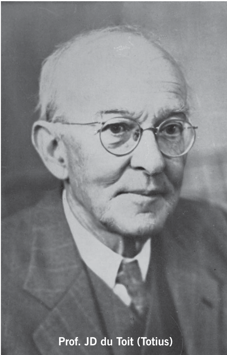
Prof. JD du Toit (Totius)