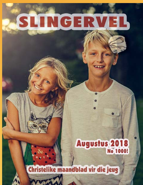
SLINGERVEL, JAARGANG 60 Nommer 1000, Augustus 2018

A s julle enige vrae het, iets wat jy nie verstaan nie, of oor iets wat in die Slingervel geskryf is, meer wil weet, is julle baie welkom om vir my ⇒ 'n sms te stuur of te whatsapp na 084 551 2107, ⇒ of 'n e-pos te stuur na slingervel@gksa.co.za , ⇒ of 'n brief te stuur na Posbus 88, Bloemhof 2660